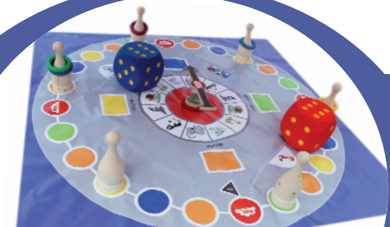
Unser Inklusionsspiel - (3m x 3m)